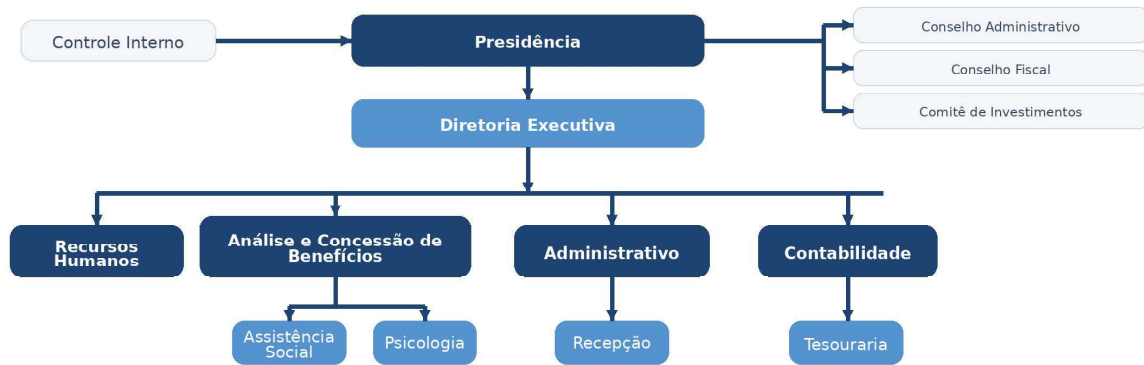
Organograma institucional do IPPA